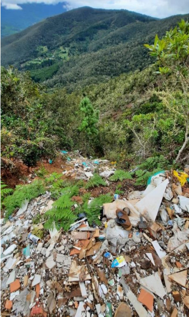
Fotografía 1. Vertedero ilegal de residuos sólidos encontrado en Cerro La Roca.

escena encontrada puede considerarse como un posible foco de contaminación, considerando la cercanía de las nacientes de agua que abastecen las localidades de Santa Cecilia y El Rodeo. Ver fotografía 1.